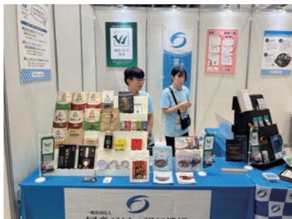
▲認証施設の加工品展示の様子