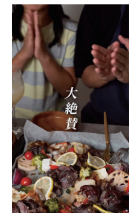
動画のキャプション