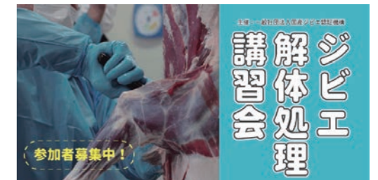
▲募集告知時のパネル

厚生労働省のガイドラインに沿った解体処理方法や、食肉処理施設での衛生管理方法を伝える本講習会を、2025年度は5回開催いたしました。国産ジビエ認証取得施設を会場に、狩猟者の方や、ジビエ解体処理施設に勤務されている方、これから処理施設を建設予定の方などにご参加いただきました。