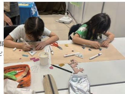
▲ワークショップの様子