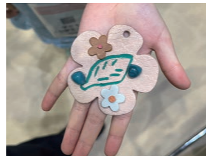
▲出来上がったチャーム